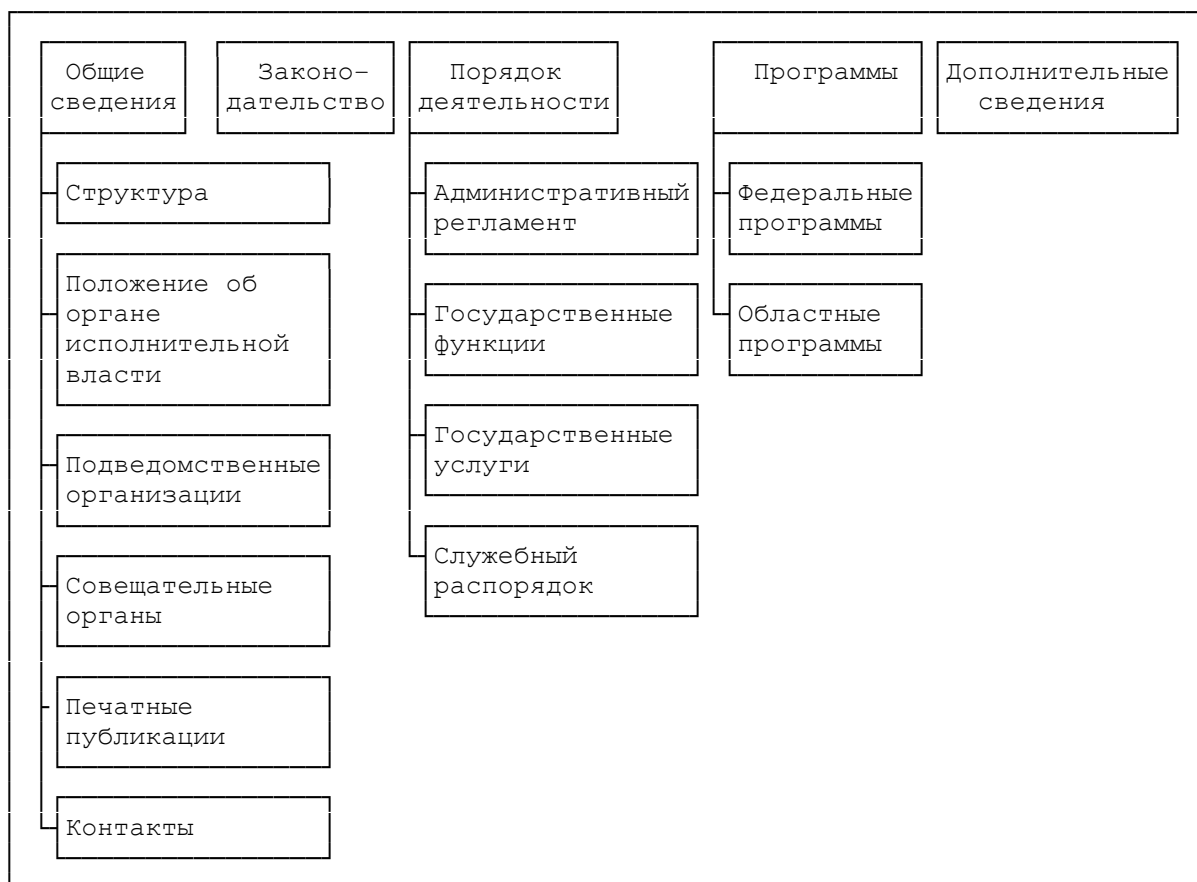
Схема навигационной панели интернет-сайта органа исполнительной власти